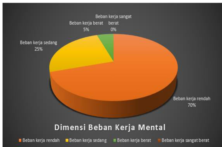
Gambar 2. Hasil responden berdasarkan dimensi beban kerja mental